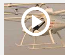
Prima 'corsa' per taxi volante senza pilota