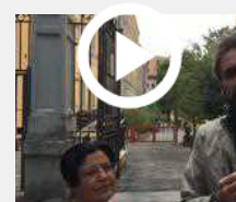
Lo Ius soli visto dalla Roma multietnica